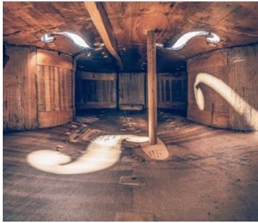
The cello once hit by a train , 2020 Charles Brooks